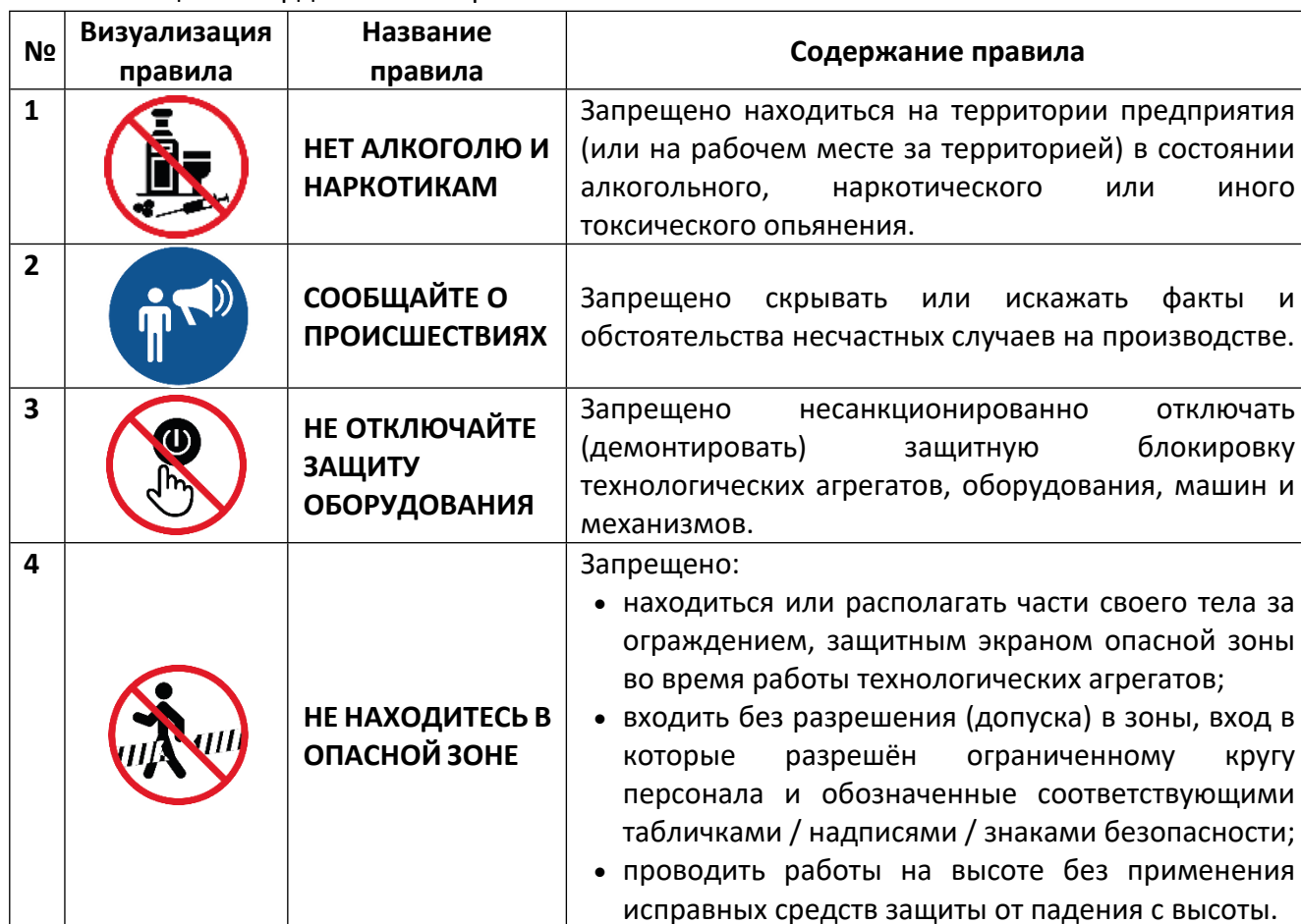
Таблица 2 – Кардинальные правила безопасности

6.2. Все работники предприятия, работники подрядных и субподрядных организаций не должны приступать к выполнению работ, если они заведомо сопряжены с нарушением правил, указанных в п. 6.1.